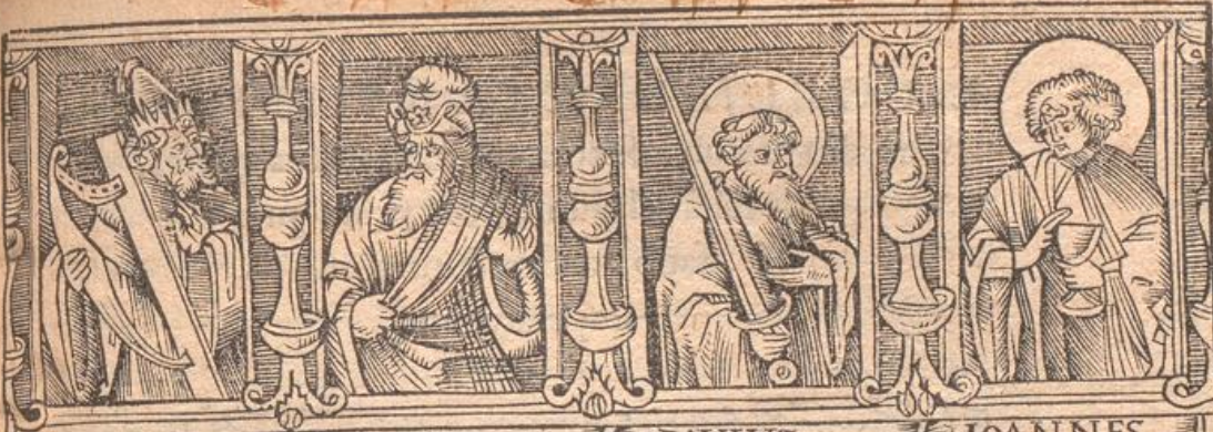
DAVID ESAIAS PAVLVS IOANNES